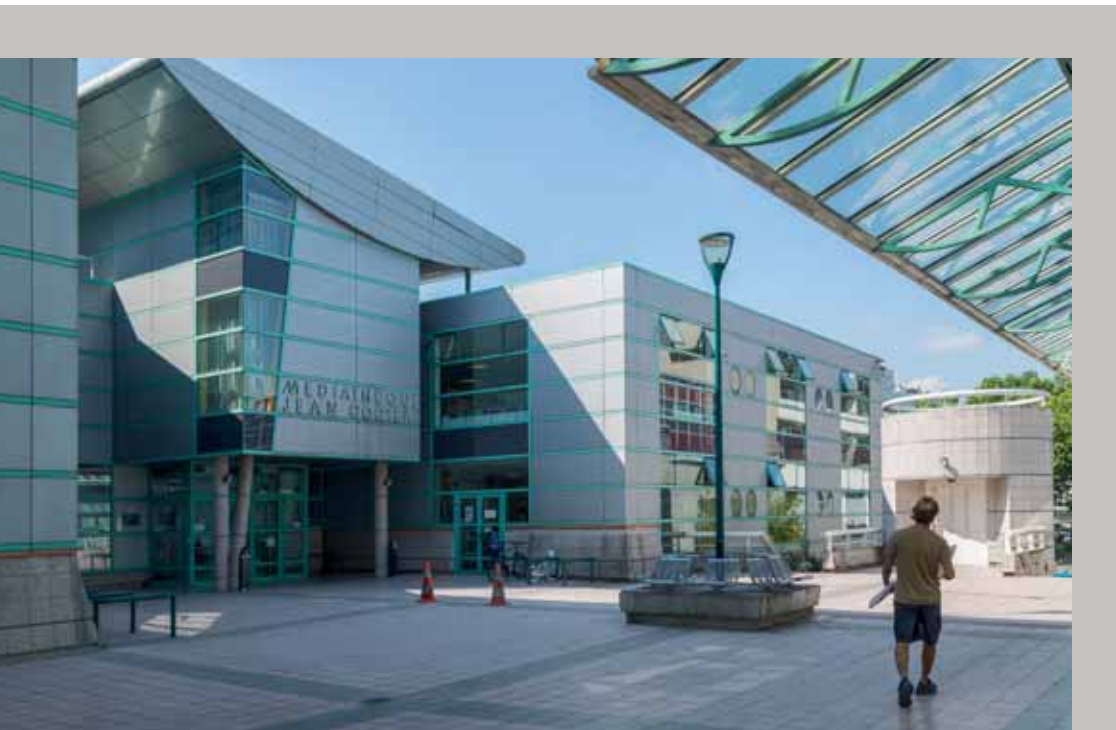
Médiathèque Jean Cocteau

Le Cover Green s'installe avenue de la République à Massy, quartier Opéra, calme et résidentiel, qui accueille de nombreux services et commerces de proximité, pour une vie agréable au quotidien.