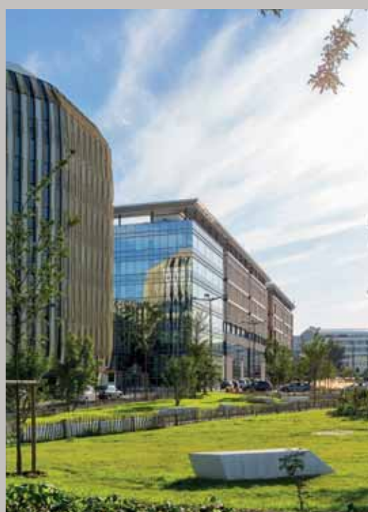
Mail du Commandant Cousteau