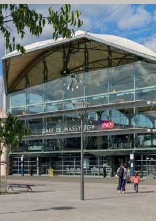
Gare TGV de Massy