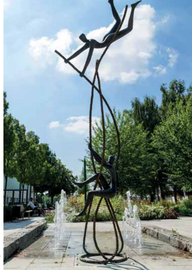
Fontaine du Noyer Lambert

Située à quinze kilomètres au sud-ouest de Paris, Massy est très accessible, avec l'autoroute A10, la nationale 20 et la nationale 188. Côté transports, la Ville est très bien desservie avec notamment la gare SCNF/TGV et bientôt la ligne 18 du Grand Paris Métro Express.